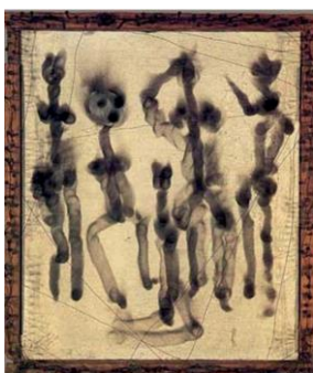
Wolfgang Paalen, Fumage , 1937

genoeg. Ik wil niet vast blijven houden aan kunstwerken die af zijn, mijn kunstcollectie groeit dan alleen maar en uiteindelijk word ik eigendom van mijn kunstwerken. Maar wij moeten allebei vrij zijn.” Het kunstwerk in het filmpje werd niet verkocht.