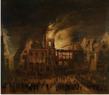
Gerrit Ludens, Brand in het oude stadhuis op de Dam , 1683 (Amsterdam Museum)

Op de plek waar nu het Paleis op de Dam staat, stond in Amsterdam vroeger het oude, middeleeuwse, stadhuis. Op 7 juli 1652 woedde hier een grote brand die het gebouw volledig verwoestte. Om kostbare papieren, munten en archiefstukken te redden, waagden verschillende mensen hun leven door de brand in te gaan. Slechts een deel van de papieren en munten werd gered. Vraag: hoe wordt hier de brand geblust?