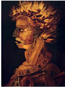
Arcimboldo, Vuur , 1566 (Kunsthistorisch Museum Wenen)

U vindt het beeldmateriaal op https://www.brwmh.nl/index.php/nl-nl/plan-je-bezoek/code-rood