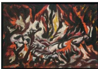
Jackson Pollock, The flame , 1934-38 (MoMa New York)

De Oostenrijkse kunstenaar Wolfgang Paalen was de uitvinder van de fumage-techniek. Bij een vlam hield hij een vel papier, de roet en rook lieten sporen na op het papier. Deze sporen werkte hij vervolgens uit tot een kunstwerk.